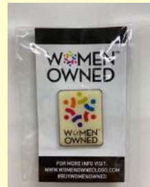
証バッジが届きました！

ウィコネクトインターナショナルとは、女性が所有し経営する企業を認定し、大企業のサプライチェーンに繋げることでマーケットアクセスを提供する団体です。グローバル化が進む日本において、女性経営者事業から商品やサービスを購入する